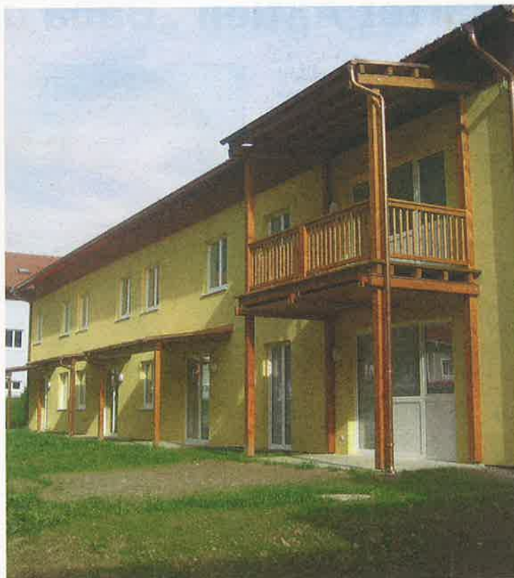
In massiver Ziegelbauweise wurde der fünfte Bauabschnitt errichtet.

Auch wenn derzeit keine weiteren Bauvorhaben in Planung sind, ist man in der Schrems weiterhin auf der Suche nach neuen Flächen. Den nur dann könne man weitere Wohnbauvorhaben realisieren. W.K. ■■